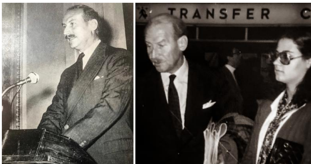
Рис. 4. Слева: Принц Петр во время чтения лекции в Греческом антропологическом институте в 1961 г. Справа: Принц Петр в последнее десятилетие жизни с автором статьи, Э.-М. Папамихаил. 1975 г.