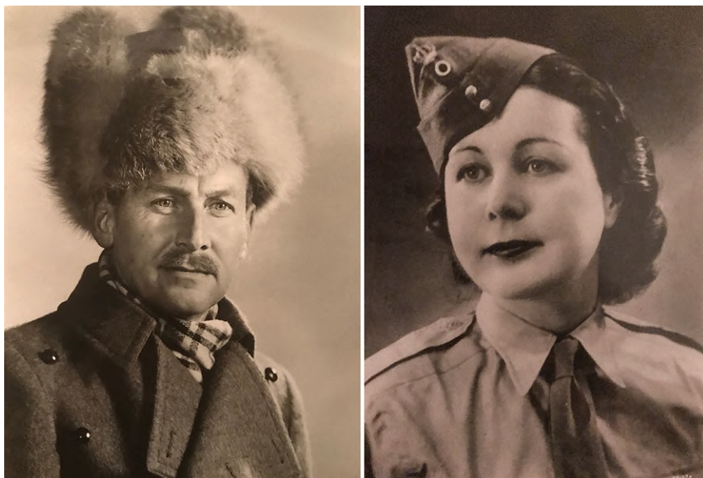
Рис. 1. Слева: Принц Петр в русской шапке-ушанке. Справа: Ирина Александровна Овчинникова в пилотке в военные годы.

Обучение в Лондонской школе экономики под руководством Малиновского принц Петр начал в 1935 г. Малиновский был в близких приятельских отношениях с Мари Бонапарт, возможно, потому что у них был общий интерес к психологии — в частности, к психологии сексуальных отношений и к остро обсуждавшейся в то время проблеме клиторидэктомии ( Frederiksen 2008 ). Малиновский даже устроил визит в Париж к Мари Бонапарт для другого своего студента, Джомо Кениата, который в будущем стал первым премьер-министром и президентом Кении ( Murray-Brown 1972: 187; Frederiksen 2008: 31 ). После года занятий Петр отправился в антропологическую экспедицию на Ближний Восток, в Индию, Пакистан и на о. Цейлон, в результате которой поставленная перед ним задача изучения полиандрии переросла в его прочный исследовательский интерес, который он сохранил на долгое последующее время. Именно в ходе этой экспедиции, в 1939 г., принц Петр и Ирина Овчинникова обручились в датском консульстве в Мадрасе. Петр позже писал, что во время церемонии его будущая супруга пролила много слез — оба они чувствовали, что находятся на рубеже больших потрясений, последствия которых предсказать было невозможно ( Peter 1969: 16 ). Отец Петра, узнав об этом браке, объявил, что отрекается от сына и отказывает ему в праве наследования на престол.